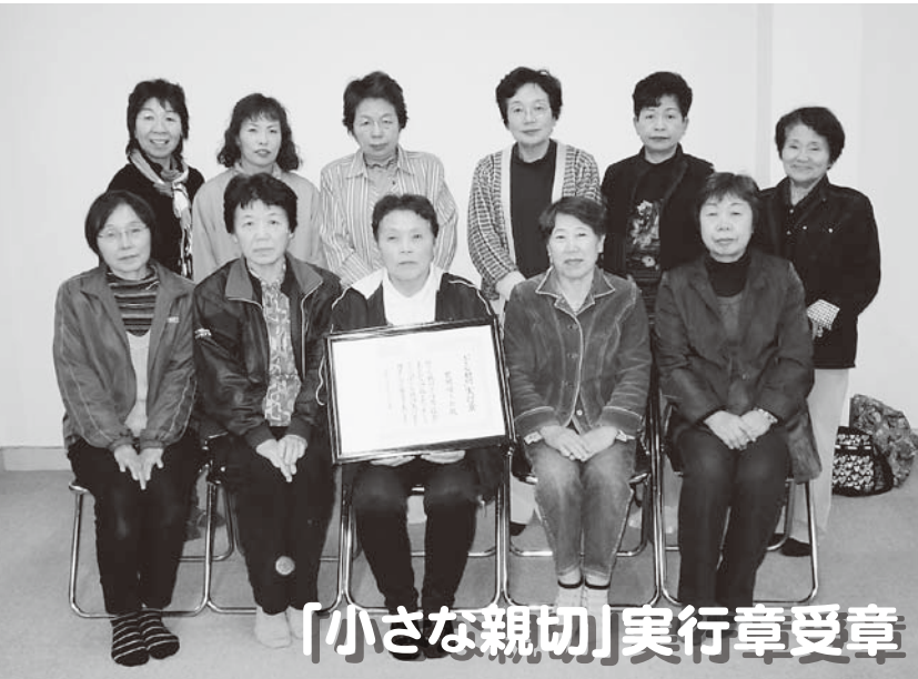
「小さな親切」実行章受章 受賞おめでとうございます。／野馳婦人会