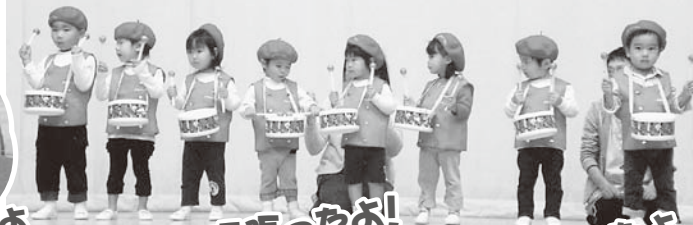
発表会頑張ったよ!