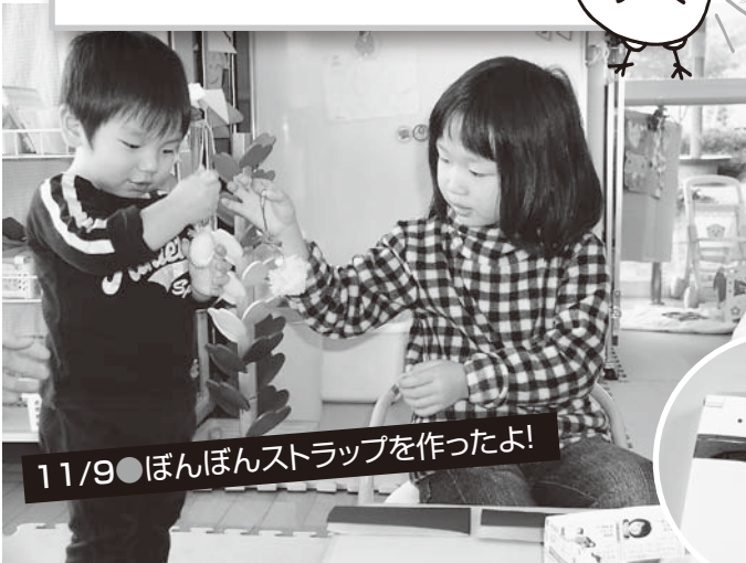
11/9●ぼんぼんストラップを作ったよ!