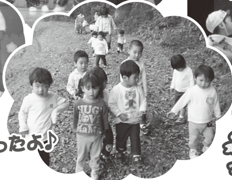
秋を見つけに お散歩だって行ったよ!