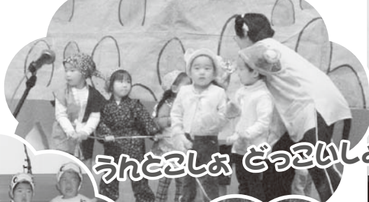
うんとおもしろいよ