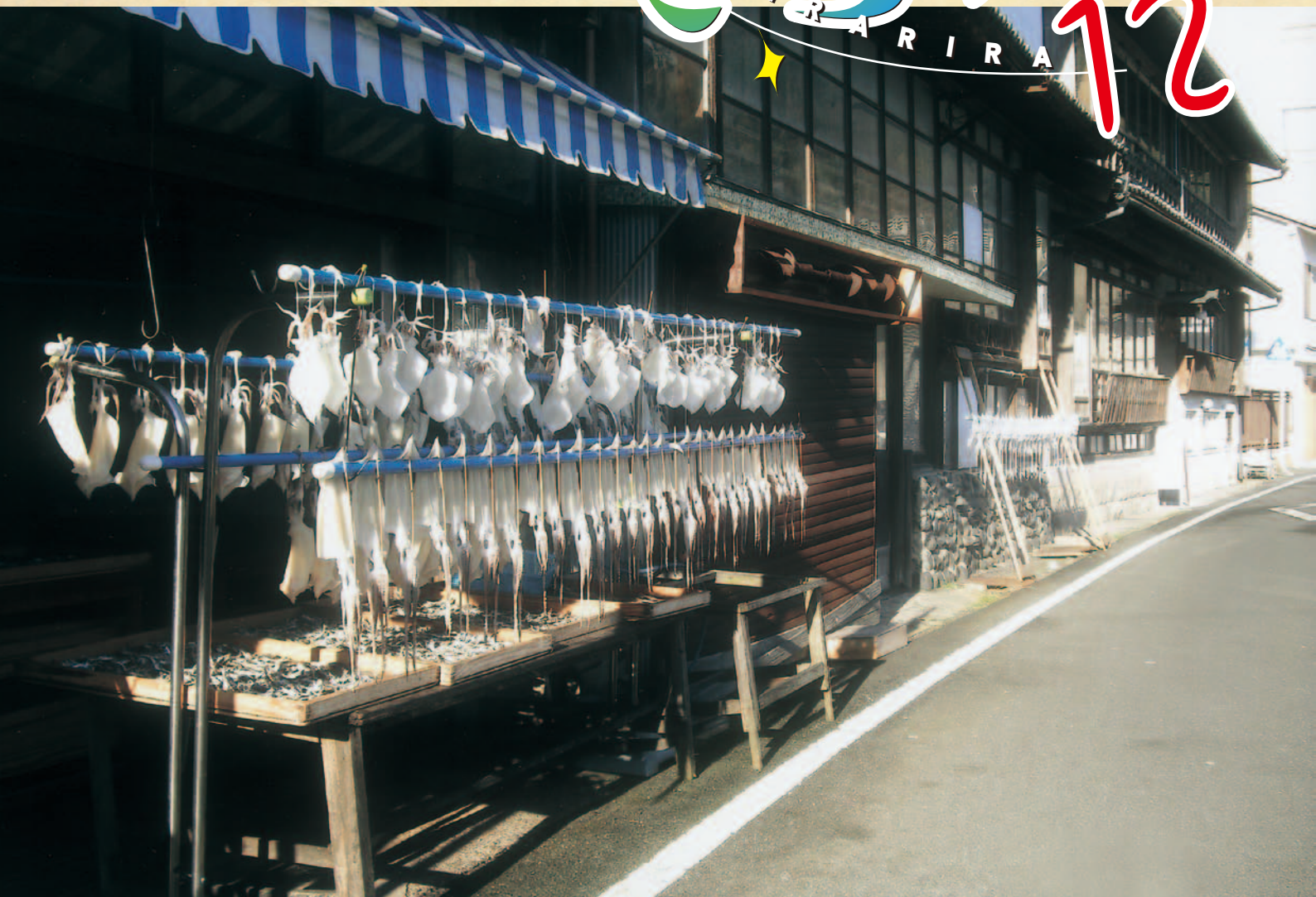
「美保関漁港の風景」