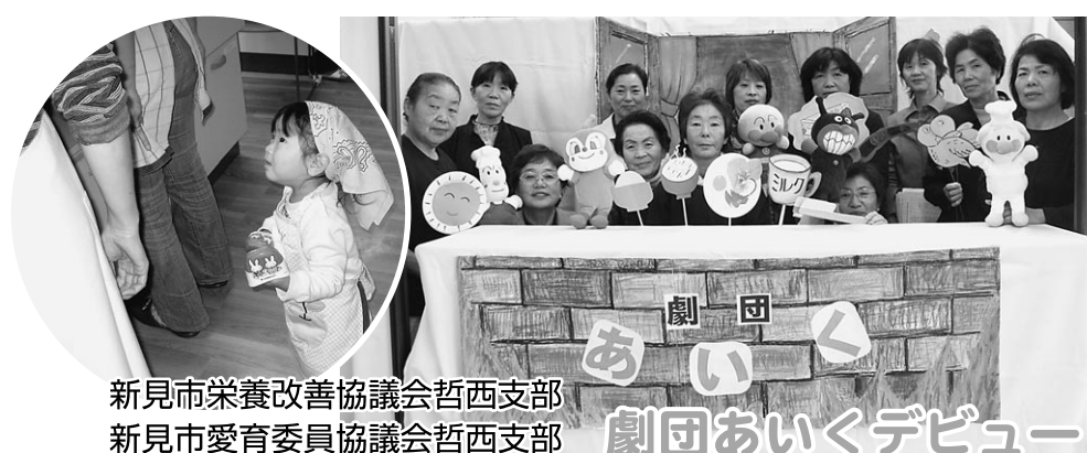
新見市栄養改善協議会哲西支部 新見市愛育委員協議会哲西支部