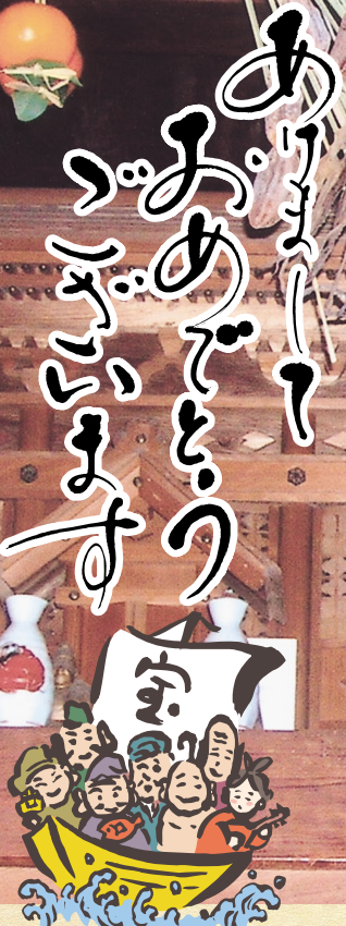
「我が家の正月」

新年を迎え、今年は「と、みんな「夢」を抱いて新しい一歩を踏み出します。昨年、NPOきらめき広場は、みなさんに支えられ「きらりら」発行、子育てサロン、福祉有償運送、図書館運営、ピアノリサイタル・健康福祉まつり・夏祭り盆踊り大会・地域安全会やクリン&グリーン作戦実行委員会などの社会活動支援と、中広い活動を活動を進めることができました。 先日、これらの活動を「地域自立型公的サービス事業推進戦略」の参考事例にと、中国経済産業局の訪問調査を受けましたが、その際、「国としても、今後、地域で充足できる公的サービス等を地域で担うという戦略が、地方中小都市を中心とする地域、とりわけ中山間地域においては重要と考えている。中でも、これらの地域における公的サービスの水準をいかに維持していくか、その方策実施が急務であり、今後、公的サービスをコミュニティ・ビジネスと捉えてNPOなどがその力を発揮して欲しい。」と激励を受けました。 みんなの力を結集して、地域を支えていくNPO活動が大きく進むことを『今年の夢』したいと思います。